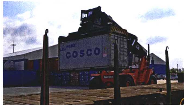
Улазак воза на интермодални терминал Нелта

„Уочили смо потребу тржишта Србије и окружења у региону за додатним решењима транспорта робе са Далеког истока. Очекујемо транспорт више од 7.000 контејнера годишње. Скраћење транзитног времена у односу на северне луке Јадрана представља бенефит корисницима, али и ослањање на интермодални терминал Нелта са којим повезујемо луку Пиреј, јер пружа широку логистичку подршку потребну за успостављање овог тока”, нагласио